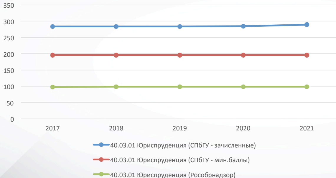
Соотношение минимальных баллов на примере направления подготовки «Юриспруденция»

Установление вузом минимальных баллов по уровню Рособрнадзора при существенном отрыве минимальных баллов зачисленных фактически приводит к введению поступающих в заблуждение относительно реальных шансов на поступление